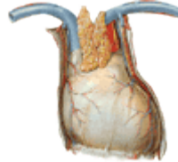
19-21 Perikard (Kreislauf)

19 Blutdruck und Puls werden heruntergefahren 20-21 Antibiotika und Allergiemittel werden besonders gut aufgenommen Phase der Erholung und Entspannung der Hauptorgane bei Störungen treten Depressionen auf